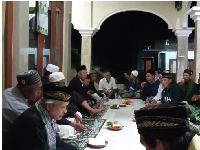
Gambar1: Majelis ilmu keislaman yang dilakukan secara langsung