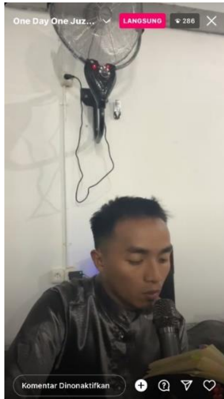
Gambar 3: Contoh kegiatan ilmu keislaman mengaji bersama melalui live instagram

Berikut contoh gambar digitalisasi ilmu keislaman melalui sosial media: