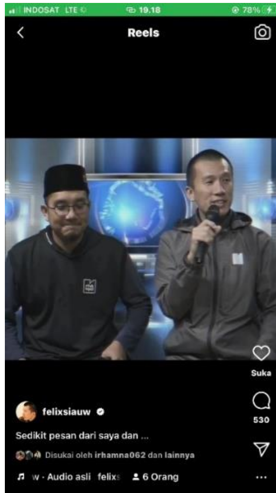
Gambar 4: Contoh kajian ilmu keislaman di reels instagram